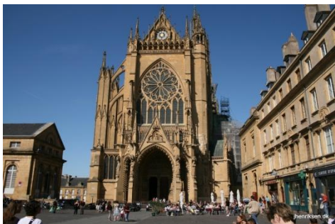
Kirken i Metz med markedshallen til venstre

Der er rigemuligheder for indkøb indenfor få km. Lavprismarkeder, og mega indkøbscentre. Et godt sted for indkøb af godt udendørs- og sportstøj samt sportsudstyr er Decathlon, med rimelige priser og god kvalitet. De har deres eget mærke Quechua (opkaldt efter indianerne i Ecuador, Bolivia og Peru) og så er der mærkevarer. http://www.decathlon.fr/