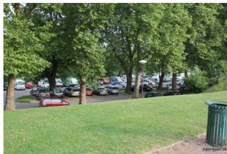
Autocamper pladsen i Metz

I Metz er der også en fin lille plads AC pladsen ligger lige uden for campingpladsen, sidst vi var der i 2014 var det gratis at holde. Pladsen er rigtig god for en tur rundt i Metz, der er en dejlig by. Hvis det frister, er det indendørs markedet over for den store kirke et besøg værd.